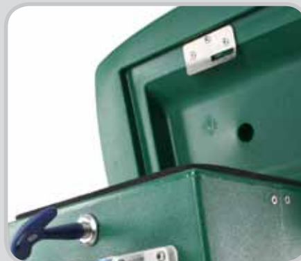
Sécurité par clé spéciale